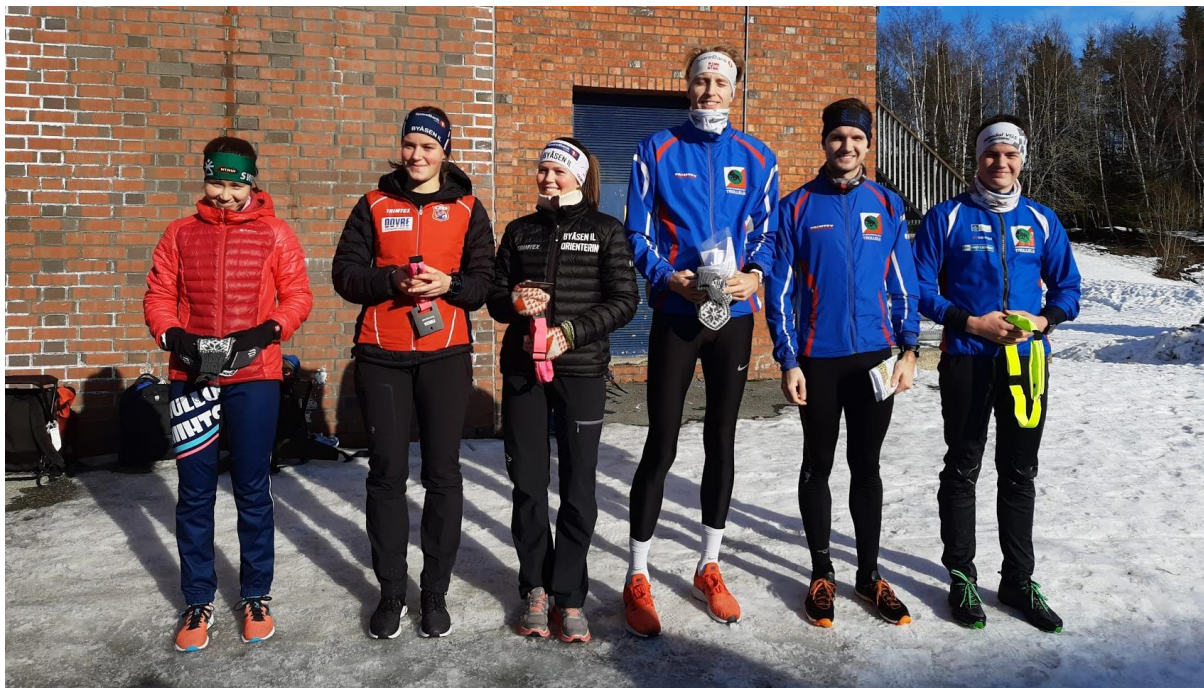
Trollelg tapetserte pallen i herreklassen under 2020's utgave av Heimdal Vintersprint