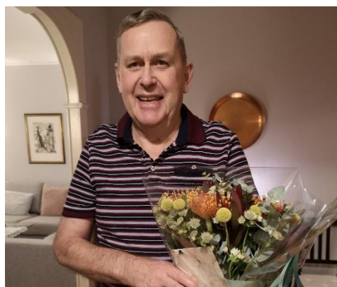
Noen av årets jublanter