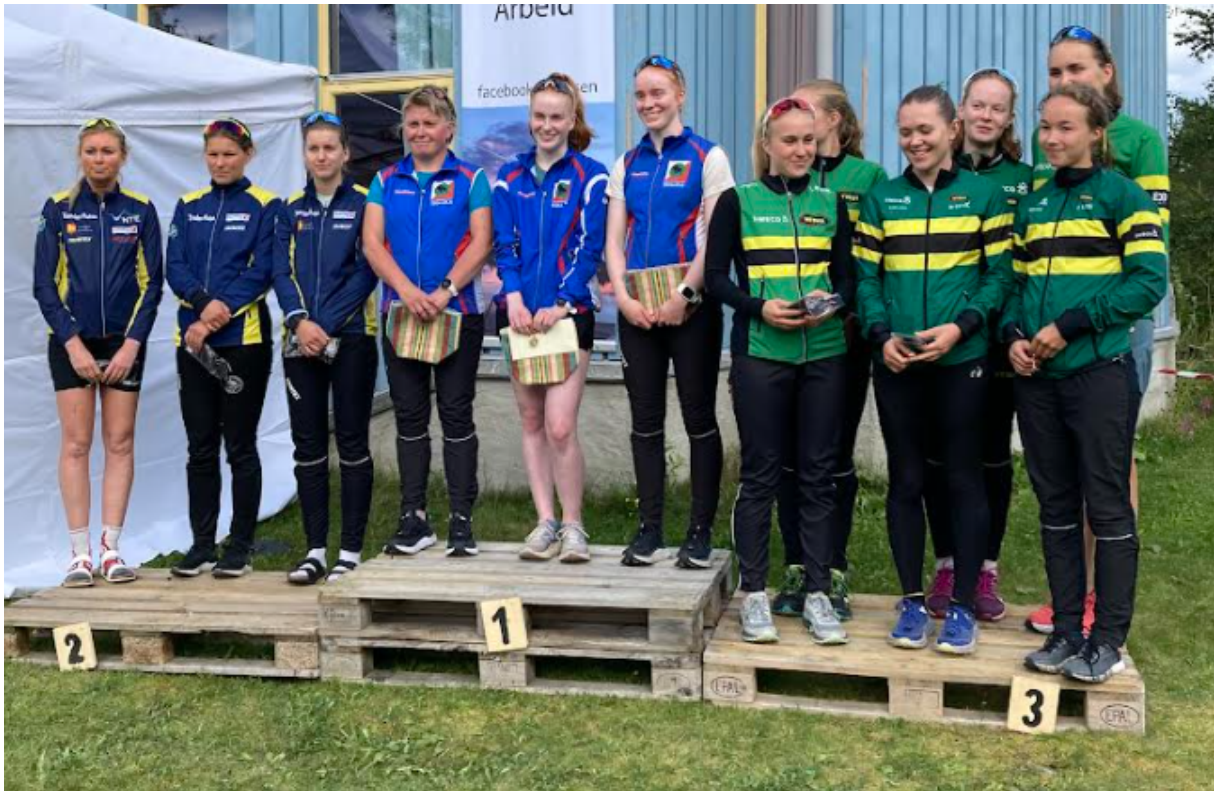
Pallen i D21 på MNM stafett.

Alle NM-arrangementene ble gjennomført. Vi kan rapportere om gode resultater på flere av distansene.