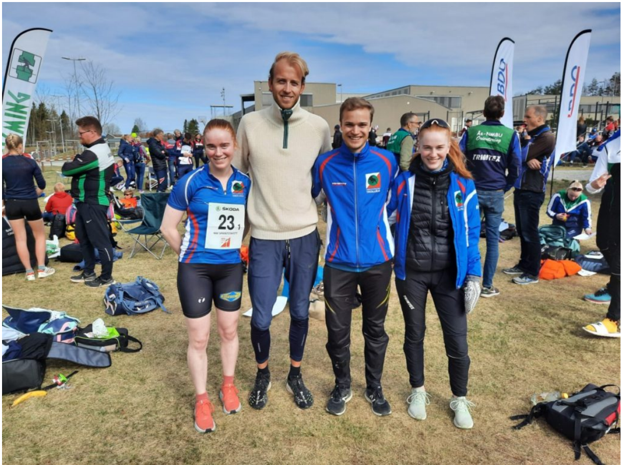
Trollelgs lag på NM sprintstafett.

Noen uker senere ble seniorenenes sprint-NM i individuell start arrangert av Skien OK. Trond Einar var eneste startende fra Trollelg, men løp et veldig bra løp som holdt til sølvmedalje! Og dermed beholder klubben den gode statistikken med medaljer fra nasjonale mesterskap 11 år på rad!