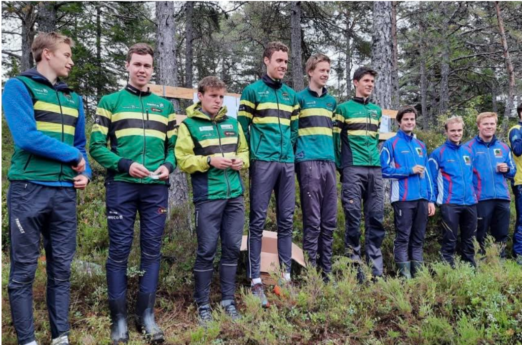
Bronselaget i H21 på KM-stafett.