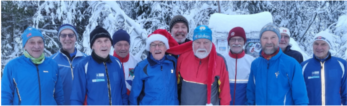
Gubbetrening i 2022.