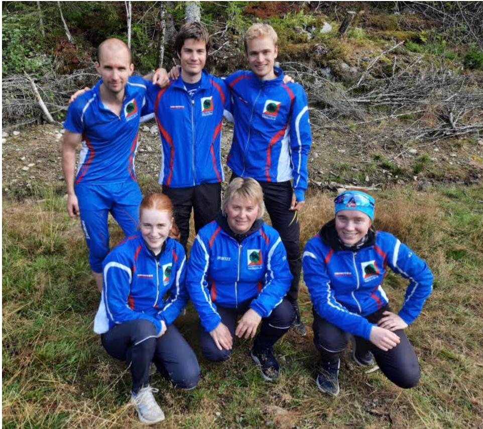
Trollelgs NM-lag.